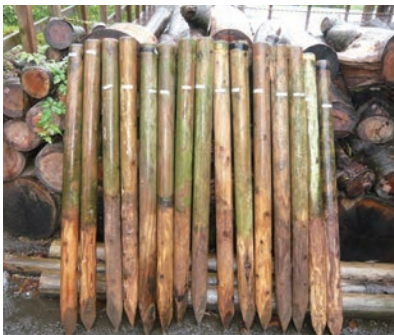
写真9-3 加圧注入処理した遊歩道ロープ支柱 (スギ丸太：φ=70mm、L=1200mm) の13年経過後の様子

した被害度)。規格では平均被害度が2.5に達した年数を耐用年数と定め、処理は無処理の3倍以上の耐用年数を求めています(写真9-2)。各種の加圧注入処理木材を全国各地で暴露試験した結果のデータベースは、(公社)日本木材保存協会のホームページで公開されています(URL : http://www.mokuzaihozon.org/ )。暴露場所の状況や気候環境によって差があり、また、素材では樹種や辺心材によって、処理した木材では薬剤の種類や処理量によって違いがありますが、大体スギの辺材では2～3年で被害度が2.5に達するものの、処理した木材では多くの場合10年を越えても健全な状態を示しています(写真9-3)。