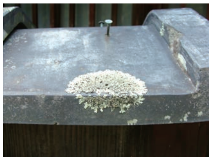
写真10-1 屋根瓦の表面で生育するキクバゴケ類の仲間

古い屋根瓦にコケの固まりのようなものが生えていることを目にされたことがあると思います(写真10-1)。これは一体何なのでしょう。実は葉状地衣類のウメノキゴケ科に属するキクバゴケ類で、コケという名前が付いていますがわれわれが一般的に目にするコケ(苔)とは異なる生き物です 1) 。