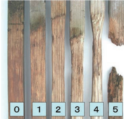
写真9-2 野外防腐試験での被害度の例

した被害度)。規格では平均被害度が2.5に達した年数を耐用年数と定め、処理は無処理の3倍以上の耐用年数を求めています(写真9-2)。各種の加圧注入処理木材を全国各地で暴露試験した結果のデータベースは、(公社)日本木材保存協会のホームページで公開されています(URL : http://www.mokuzaihozon.org/ )。暴露場所の状況や気候環境によって差があり、また、素材では樹種や辺心材によって、処理した木材では薬剤の種類や処理量によって違いがありますが、大体スギの辺材では2～3年で被害度が2.5に達するものの、処理した木材では多くの場合10年を越えても健全な状態を示しています(写真9-3)。