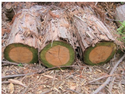
写真11-4 伐倒して放置されたヒノキ丸太に発生した変色菌

さて、写真11-4は伐採されて林地に放置されていたヒノキの幹です。周囲の辺材部（コラム「木材保存」第1話）が鮮やかな緑色を呈しています。本来、この部分は白いはずで