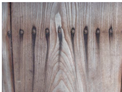
写真11-3 扉板の釘から発生した鉄汚染

写真11-3をご覧ください。木製の扉に打たれた釘から垂れたように黒沁みが発生している様子が見えます。これは、釘の鉄イオンと木材中のタンニンやフェノール性成分とが化学反応を起こし、黒色の錯化合物がつくられたためと考えられます。鉄と木材が乾燥した状態で接触しても汚染は生じませんが、鉄がイオン化して水に溶解し、木材のフェノール成分と反応する時に汚染が生じると言われています。