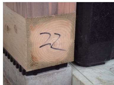
写真9-4 加圧注入処理後の切断によって薬剤の未浸潤部(中央部)が露出した土台材