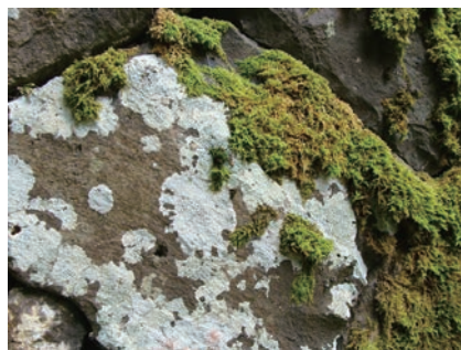
写真10-3 石垣の表面に見られたレプラゴケと思われる地衣類（白い層）

カリ性を見分ける実験で使用するリトマス試験紙は、リトマスゴケという名前の地衣類の化学成分を利用して作られるということです。