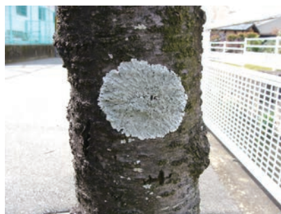
写真10-2 桜の幹に生育しているウメノキゴケ

桜や梅の木にも地衣類が生育しているのをよく目にします。写真10-2は桜の幹に付着した地衣類の一種のウメノキゴケです。ウメノキゴケの成長速度は遅く、対象物が動くと付着できません。梅や桜の枝や樹皮に大量のウメノキゴケがついているのは、樹木の成長が遅れたり弱ったりしていることを示します。しかし、地衣類は樹幹から栄養を摂るわけではなく、樹木を弱らせることはありません 2) 。