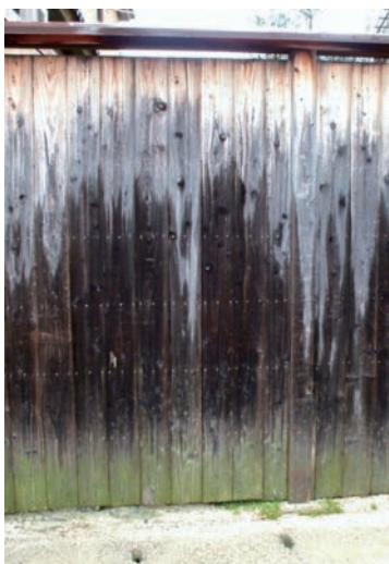
写真11-1 無塗装の板壁に発生した複合汚染

その結果、外装に使用された木材は、日射による影響やカビなどの生物的作用を複合的に受けることになります。写真11-1は小屋根の付いたスギの板壁ですが、無塗装で施工後5年余り経過した状態です。上部から下部に向けて、黄変→退色→黒カビ汚染(乾燥)→黒カビ汚染(湿潤)→緑藻類汚染→地面からの跳ね返り汚染、が発生しています 2) 。