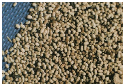
写真6-4 アメリカカンザイシロアリによって被害材から排出された糞

また最近、わが国で、アメリカカンザイシロアリという変わり者のシロアリによる被害が時折話題になっています。このシロアリはアメリカから渡ってきた種類で、土中ではなく乾いた木材中でのみ生息し、生存に必要な水分も気乾状態にある木材から求めている乾材（カンザイ）シロアリです。このシロアリの場合、からからに乾いた粒状の排泄物が特徴で、発生を知る証拠にもなります(写真6-4)。