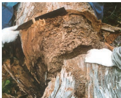
写真6-3 木の根元で見つかったイエシロアリの巣

イエシロアリは年月が経つとかなり大きな巣をつくりますが（写真6-3）、ヤマトシロアリは加害箇所が巣を兼ねていることが多いです。この巣は、唾液と土と排せつ物でつくられ、内部の女王のいる部屋を取り囲むようにできています。建物の中にイエシロアリの巣がつくられることはまれですが、壁の中やお風呂場の床下などに、あるいは古い建造物で