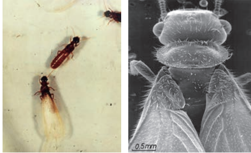
写真7-3 イエシロアリの羽蟻(左)とその拡大(右)

ちですが、進化的には両者は大きく異なり、アリはハチと同じ膜翅目に属し、完全変態(幼虫から蛹の段階を経て成虫になる)をする高等な昆虫です。それに対しシロアリは等翅目昆虫であり、不完全変態をする下等な、むしろゴキブリに近い種です。