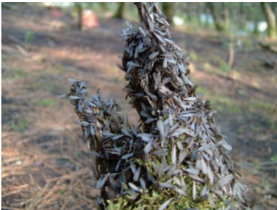
写真7-2 ヤマトシロアリの群飛