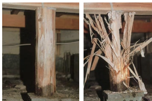
写真8-2 外見上は健全な束(左)だが、内部は激しいシロアリの被害(右)

通風や光を避ける行動習性から、シロアリに加害された柱では表層を残し、内部が激しく食害を受けている場合がしばしば見られます。写真8-2の左側は一見したところ健全な束ですが、よく調べてみると内部は激しく劣化しています（右側）。こういった習性の結果、