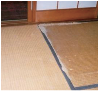
写真8-4 畳のすき間に詰められたシロアリによる蟻土

シロアリの攻撃は木材内部で進行し、被害の発見が遅れることとなります。加害箇所を蟻土と称する土と排泄物等を混ぜたもので覆ったり、すき間を埋めたりするのもシロアリの習性によるもので、畳のすき間や部材の割れ目が蟻土で埋まっているのが見られると、シ