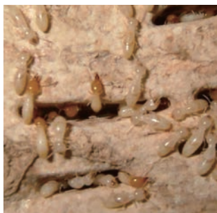
写真6-1 木材を食害中のイエシロアリ

シロアリは通常、温暖で高湿度の環境を好み、地球上では赤道域の熱帯地方にその多くが分布しています。日本には20種くらいのシロアリの生息が報告されていますが、ほとんどの種は南西諸島を中心とする南の亜熱帯性地域に棲み、本州ではイエシロアリとヤマトシロアリの2種が主なシロアリで、建築物に被害を及ぼす重要な種類です（写真6-1）。