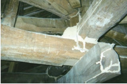
写真8-3 小屋組みの部材で発見されたシロアリの蟻土