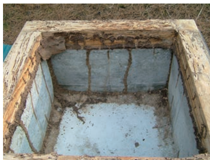
写真6-2 床下モデルの人工的な間隙から立ち上がったイエシロアリの蟻道

イエシロアリとヤマトシロアリは地下生息性シロアリと称されるグループに属するもので、いずれも水分の供給を地下に求め土の中をおもなすみかとしています。土と排泄物でつくったトンネル状の蟻道を通して移動し、床下の基礎や束から建物内部に侵入して被害を及ぼします（写真6-2）。特にイエシロアリの場合は行動範囲が広く、樹木の根元に巣をつくっていても、地下トンネルの蟻道を通してかなり離れた場所の建物の中まで侵入してくる場合が多くみられます。