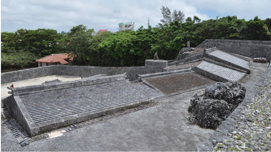
写真5 墓室屋根（西から東を望む）と琉球石灰岩の露頭