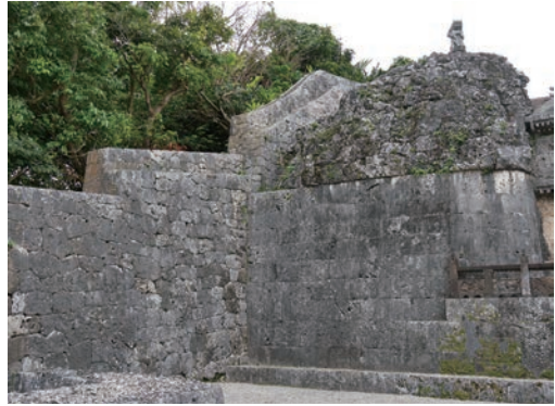
写真6 東端の石牆、琉球石灰岩の露頭、石獅子

玉御殿があくまでも対称性を忌避して独自の造形を追求し、「嵩高偉大なる建築」を創ったことは、類い希なできごとである。琉球王国の建築文化の伝統や固有性を継承しながら、新規な様式の創造を企てるその大きな動因となったのは、宗主国の明や朝鮮、日本などの対外関係に由来する、いわば「近代化」の自意識ではなからうか。