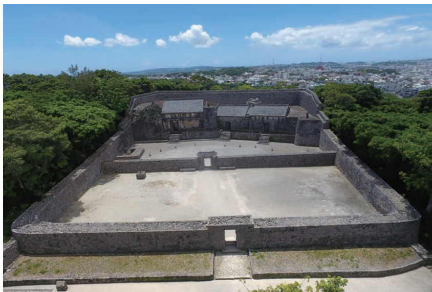
写真1 玉御殿 墓室及び石牆全景（北から南を望む）

令和元年7月7日、玉陵の所有者である那覇市によって「玉陵国宝指定記念シンポジウム」が開催され、私も国宝指定にかかわった一人として基調講演の機会をいただいた。「ユーラシアのなかの玉陵」について説明し、玉陵は「琉球が東アジア世界との交流のなかで創出した独自の歴史と文化を象徴しており、世界の、日本の、沖縄の文化遺産として格別に優れた価値をもっている」と述べた。ありがたいことにシンポジウムではさまざまな点で