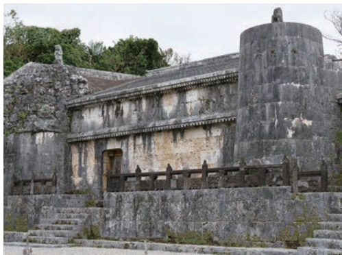
写真3 巖頭・東室・円塔、基壇