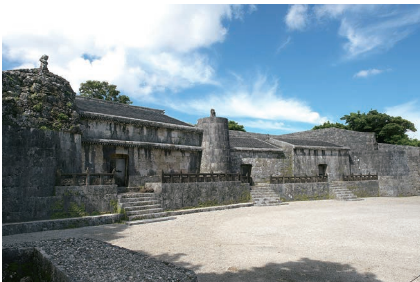
写真2 玉御殿 墓室全景（東から西を望む）

玉陵は琉球石灰岩の石垣によって墓域の外周を囲み、また墓域を内郭と外郭の二つに区画している。その外郭の庭、東方に尚真王が建てた石碑「たまおどんのひのもの」（中国福建省産の輝緑岩製、1501年）がある。この碑文からもともと「たまおどん」と表記、発音されていたことがわかる。琉球史家高良倉吉によると、「王府レベルの行政文書では「玉御殿」と表記されるのが常である」という。