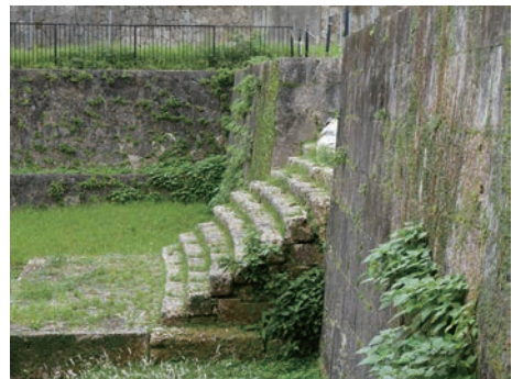
写真8 円覚寺にみる石造技術 石階の曲線（視覚補正）