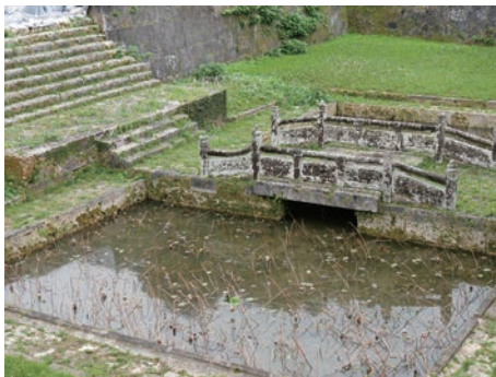
写真7 円覚寺にみる石造美 放生橋（重要文化財、1498年）と石階

ところで、第一尚王統の時代にはすでに中国から仏教・道教・天妃信仰が、また日本からも仏教・熊野信仰・伊勢信仰などが伝わっていた。これら外来の宗教・信仰のうち王権と深くかかわつたのは禅宗（臨済宗）であり、禅宗寺院は首都の首里に許された唯一の外来宗教・信仰の施設であつた。なお、国際交易都市那覇には臨済宗や真言宗の寺院、道教の宮・廟、波上権現などの神社建築が建てられ、国際色豊かな都市となつていた。